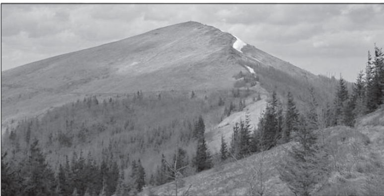
Вершина гори Парашка

З Турки над Стриєм через верхи до Майдану, а відти долиною Стрия до Корчина. На Парашку, до Бубнища. В селах живуть бойки, темні і заголюкани турчанські, й інтелігентні, підприємливі скільські. Єднає їх говір, гірська коломийка, може дещо змінений тон і прекрасний, хрустальний, зеленкуватий стрій.