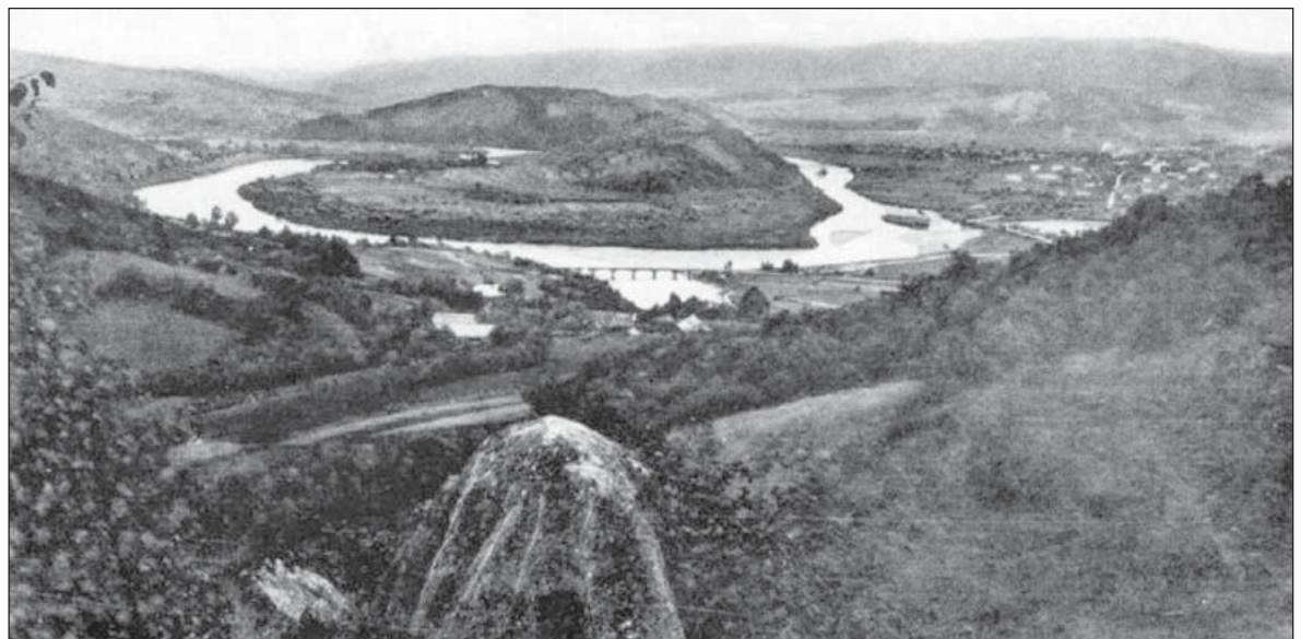
Стрийські Карпати, 1920-ті рр.

Д-р Софія ПАРФАНОВИЧ, з сайту «Фотографії старого Львова»