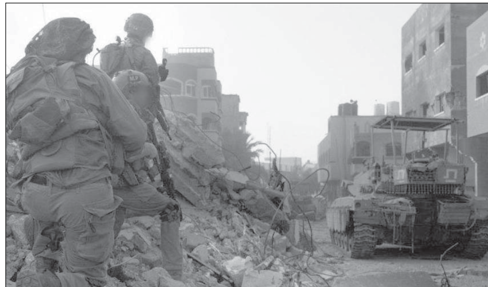
Бійці ЦАХАЛу в Секторі Гази

Поступово військово керівництво дійшло висновку, що момент повідомлення є окремою кризовою подією, яка потребує спеціальної підготовки. У 1990-х роках відкрили перші курси для офіцерів сповіщення. А в 2008-му створили спеціалізовану школу.