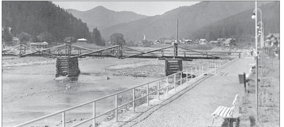
Міст, набережна і пляж на березі річки Опір в Сколе

а мені треба конче відіхати вечером залізницею. Втомлені та спітнілі добираємося в год. 12.30 до скал Бубнища. Відпочинок і їжа скріпляють нас остільки, що можемо розглянутися по дивних скалах і печерах. Справді в дивний спосіб вони накопичені, а деколи держаться одна одної тільки крайчиком; проте віками стоять ці природні замки твердині. Одно построїла природа: велитенські маси каменя, вузькі глибокі розколини, вузьонькі, темні коридори. Друге викувала рука людини: печери, сходи й комори. З глибоких розвалин виростають старі буки і