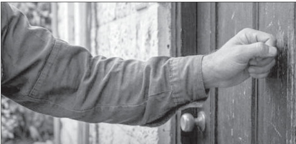
В Ізраїлі візит до родини загиблого воїна називають «стукотом у двері»