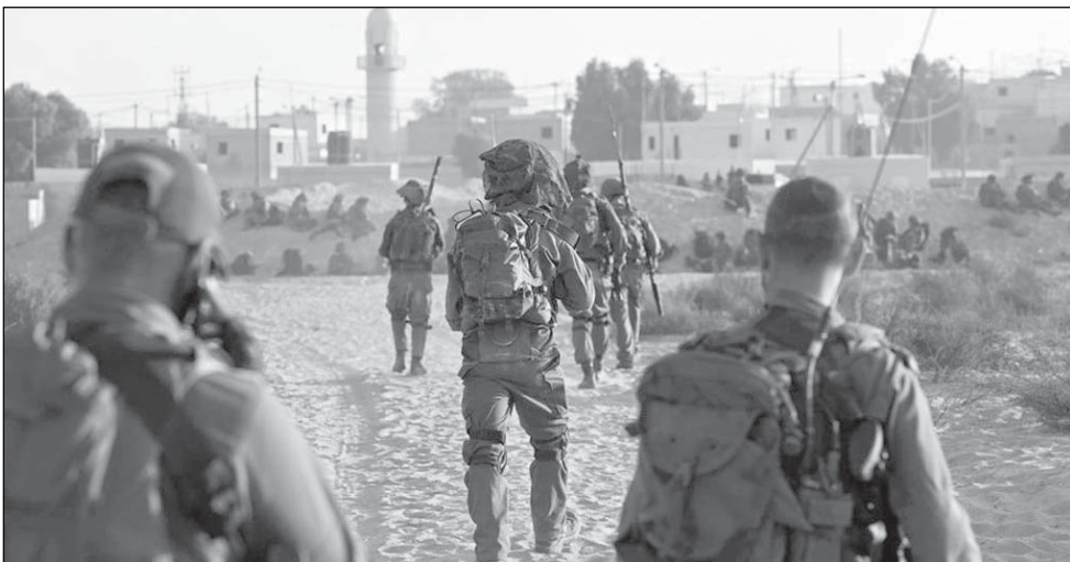
Ізраїльські військовослужбовці під час виконання бойового завдання