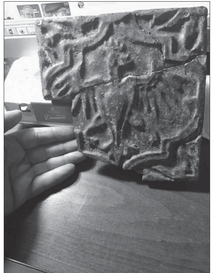
Один з етапів реставрації пічної кахлі з розкопок Стрийського замку

бургундський хрест) із розквітлим кінцями рамен, а також два вензели між раменами, а по краях монети – скорочений напис латинкою.