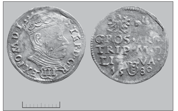
Срібний трояк (три гроші) короля Стефана Баторія із написом «1580»

Монета альбертудальдер, яку ви бачите на світліні, має виразні сліди зношення від тривалого використання і на ній є потертості з обох сторін, а також нерівні краї. Вага цього екземпляра – близько 24,65 г. На аверсі цієї монети патагона зображено герб Іспанських Нідерландів – щит з гербами в оточенні це-