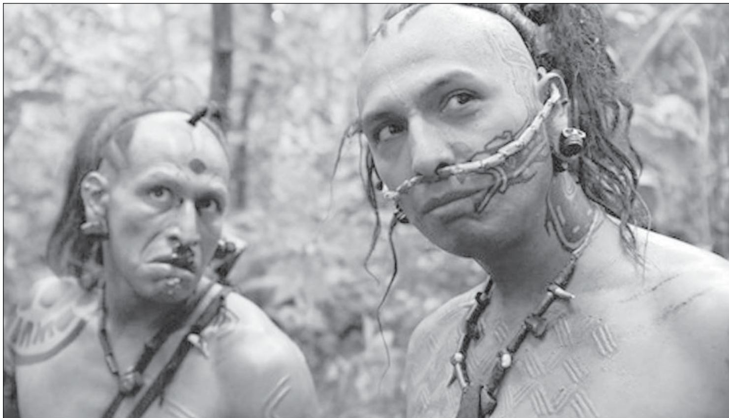
Здивовані погляди досвідчених ухилинців. Держава спробує пояснити усім заскоченим, що бронь тепер матимуть тільки по справжньому достойні!

муванні квот на бронювання. У бізнес-середовищі ці зміни називають одними з наймасштабніших від початку повномасштабної війни. Експерти зазначають, що нові правила можуть суттєво вплинути на ринок праці. Частині компаній доведеться повторно підтверджувати свою критичність, переглядати кадрову політику та адаптуватися до нових вимог щодо рівня заробітної плати працівників. Особливе занепокоєння бізнесменів викликає можливість втрати бронювання для окремих спеціалістів у сферах енергетики, логістики, виробництва та IT. Водночас у Міністерстві економіки пояснюють: оновлення системи необхідне для того, щоб усунути зловживання, які виникли за останні роки. Йдеться, зокрема, про випадки формального працевлаштування працівників за сумісництвом лише для збільшення квот на бронювання. На тлі цих змін червень стане важливим місяцем не лише для армії, а й для роботодавців, які намагаються зберегти ключових працівників в умовах мобілізації та кадрового дефіциту.