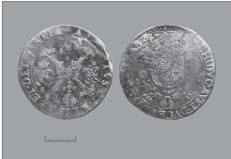
Так званий альбертудальдер, тобто один із різновидів дальдера

Під час археологічних розкопок на території колишнього замку в Стрию на Львівщині виявлено низку споруд, частина з яких згадана у давніх люстраціях (описах) та показана на картах XVII – XVIII століть. Локалізовано всі оборонні укріплення, про які до того часу було відомо лише з описів замку, зокрема bastiони зі складною системою ровів і валів, виявлено велику колекцію гарматних ядер, їхніх осколків, кулі до вогнепальної зброї (найбільше – до мушкетів), чавунну шрапнель, частину скляної гранати із шарів XVI – XVII століть та багато інших різноманітних цікавинок. Розкопки провадила експедиція відділу археології Інституту українознавства імені Івана Крип’якевича НАН України.