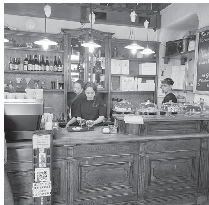
Переможець травневої збірки на дрони – кафе «Світ кави»